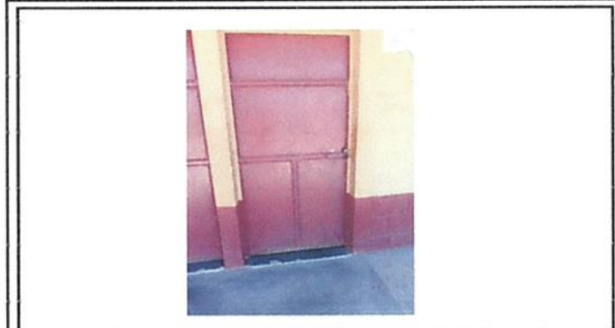
Foto 1: mantenimiento a estructura, lijado, cepillado y aplicación de pintura a puertas.